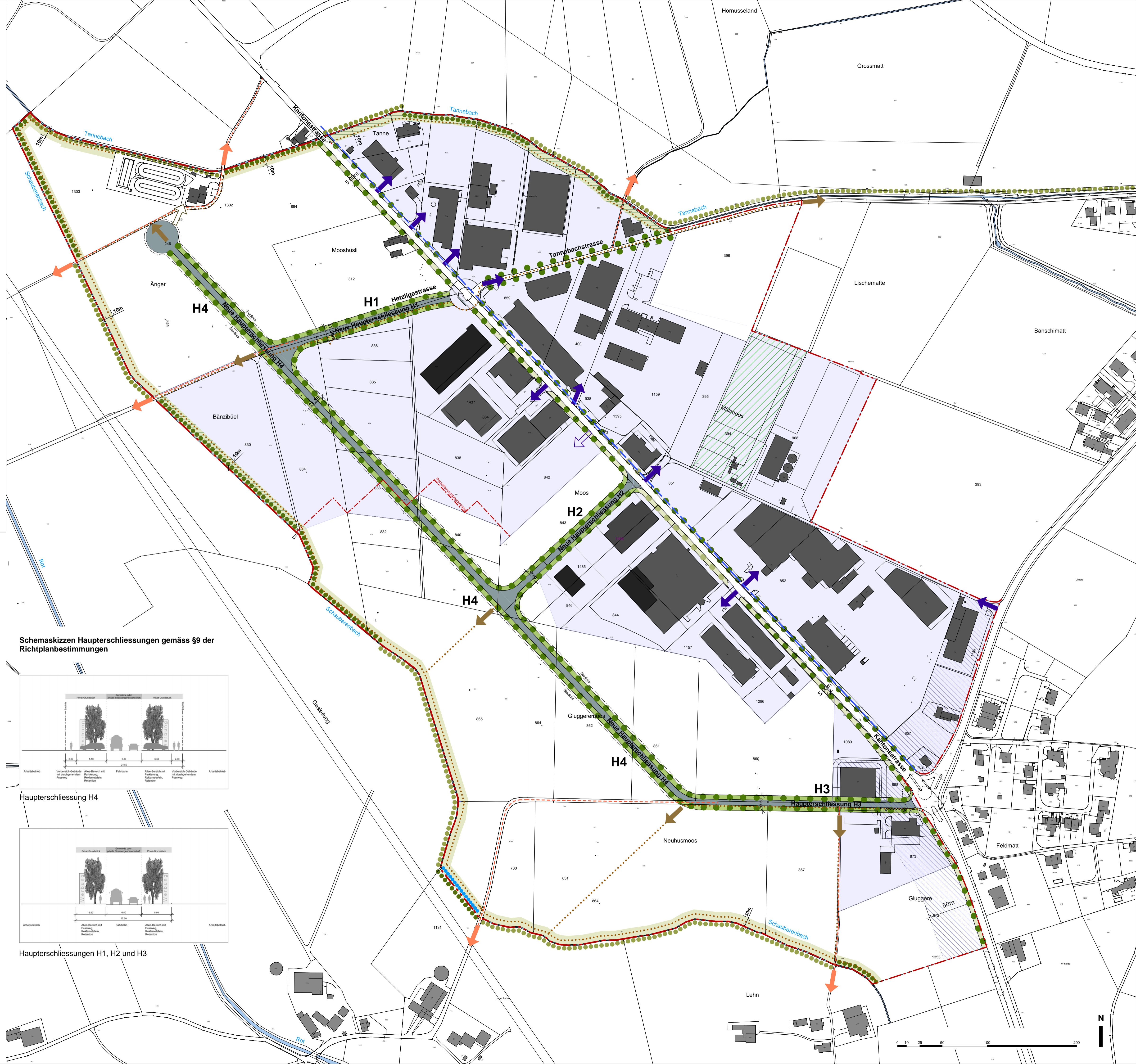
Schemaskizzen Haupterschliessungen gemäss §9 der Richtplanbestimmungen